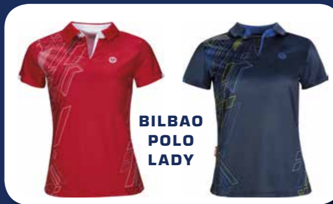
BILBAO POLO LADY

Funkční móda Oliver je určena pro všechny sportovce, kteří hledají pohodlné a stylové triko. Trika jsou vyrobena z kvalitního polyesteru (M-COOL SYSTEM). Ten kombinuje vlastnosti syntetických vláken s ještě jemnějšími mikrovláknky. Materiál je příjemně lehký, prodyšný a rychleschnoucí. Zachovává barvy i tvar, snadno se čistí a je odolný. MC COOL technologie si poradí s tím, jak regulovat tělesnou teplotu, a nadšeným sportovcům pomáhá díky komfortu při hře podávat co nejlepší výkony.