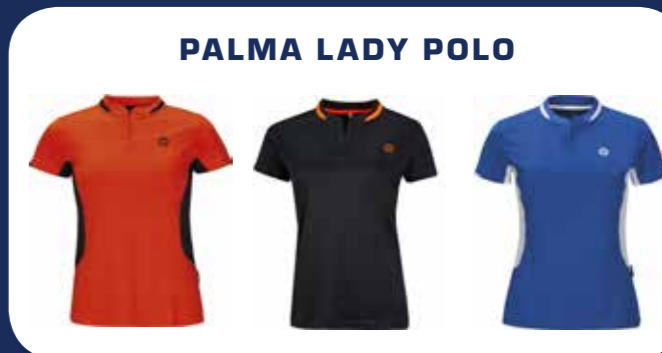
PALMA LADY POLO

Sportovní pánská a dámská funkční trička s malým logem OLIVER na hrudníku jsou velmi příjemná na nošení, mají atraktivní barvy a slušivý střih, ideální pro sport i volný čas.